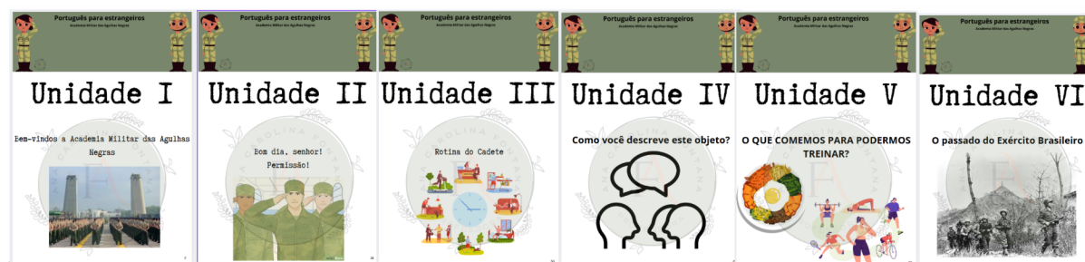
Imagem 4: Unidades didáticas construídas no ano de 2025

O material utilizado como base em 2025 é o Brasil Intercultural , da Casa do Brasil da Argentina. Trata-se de um material voltado ao meio acadêmico, cuja abordagem se adequa ao perfil esperado na Academia Militar das Agulhas Negras.